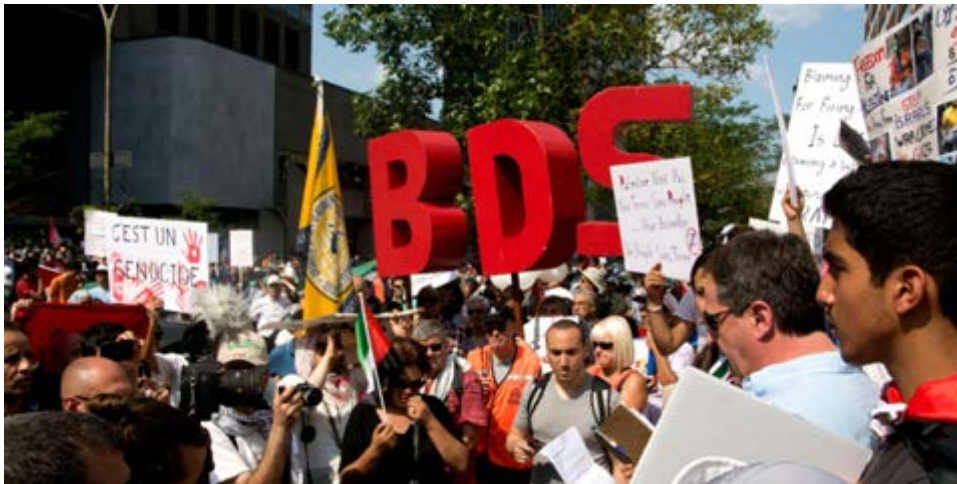
BDS-Proteste in Montreal

Noch etwas zur israelischen Demokratie: Am 29. März nahm in Israel ein Gesetz die erste Hürde, nachdem gewählte Abgeordnete von der Knesset ausgeschlossen werden können u.a., wenn sie Israel nicht als jüdischen Staat anerkennen. Wie lange man also noch das Funktionieren der Demokratie in Israel anhand arabischer Abgeordneter belegen kann, ist fraglich. 4)