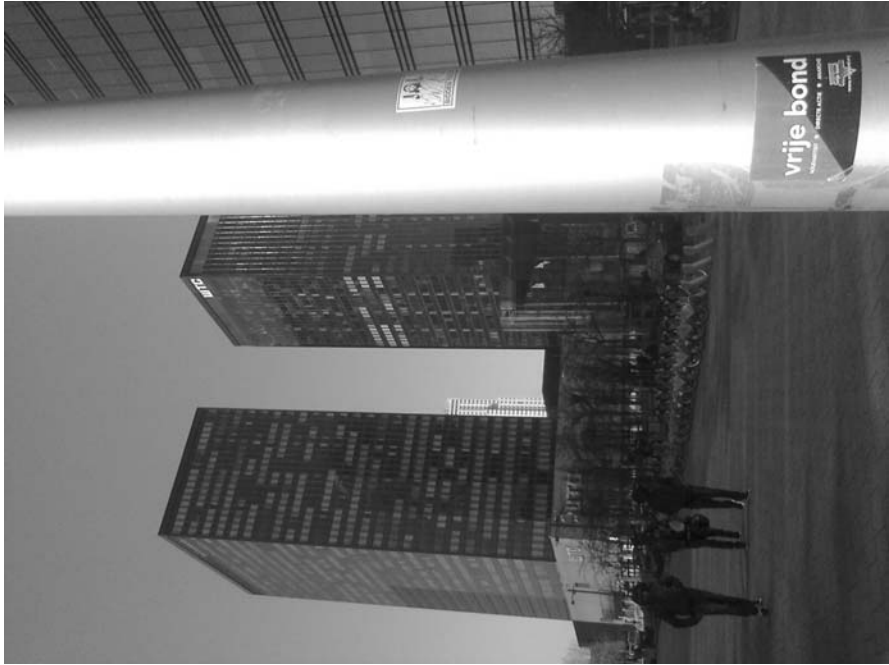
Auf der Anreise in Brüssel

Als ich von Paris zurück nach Deutschland fuhr, war ich voll beeindruckender und inspirierender Erlebnisse über die Vielfalt der anarchistischen Bewegung weltweit. Vieles, was mir bisher weit weg und abstrakt schien, hat mir dieses Wochenende nähergebracht und veranschaulicht.