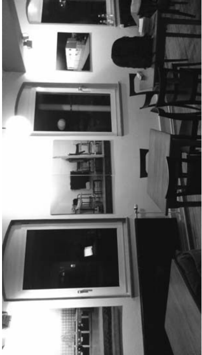
Der Kneipenraum im DemoZ

Emma-Goldman-Projekt: www.emmagoldman.be/?p=148 Libertäres Bündnis Ludwigsburg: www.lblb.pytalhost.de DemoZ Ludwigsburg: www.demoz-lb.de