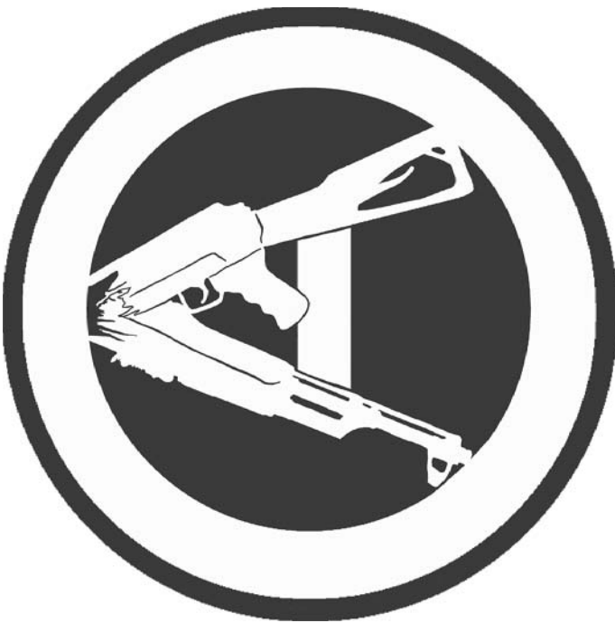
Logo der Anarchopazifistischen Jugend Köln

E-Mail: anarchokoeln@riseup.net Facebook: https://www.facebook.com/anarchokoeln Blog: http://anarchopazifistischejugendkoeln.tumblr.com/info