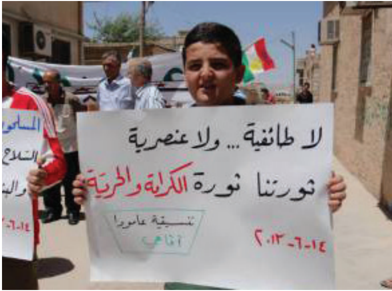
Übersetzung: Nein zu Spaltungen...Nein zu Rassismus. Unsere Revolution ist eine Revolution der Würde und Freiheit.

(mahalle), Distrikt (ilçe), Stadt (kent) und Region (bölge), welche als „Nordkurdistan“ bezeichnet wird, organisiert“.