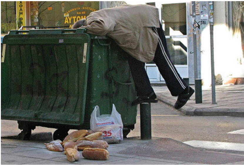
„Strukturreformen im Arbeitsmarkt“ am Beispiel Athens

lernt, lernen die Anderen nicht weniger. Wenn zehn Leute dagegen das Ziel haben, Geld zu verdienen, dann stiften sie damit ein Gegen-einander, also eine wirtschaftliche Konkurrenz. Dann können nicht alle reich werden, weil ein materieller Verteilungskampf herrscht, und jeder Euro in der Tasche des einen ein Verlust beim anderen ist. Und die Supermarktregale in Griechenland sind mit deutschen Produkten voll - so geht Konkurrenz.